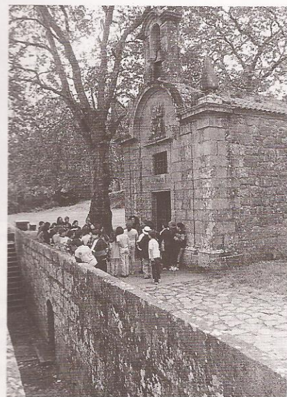
Ermida e Fonte de Santiaguíño do Monte

Dende alí, e despois de pasar pola fonte e santuario do Convento do Carme, subimos ó monte denominado San Gregorio onde se