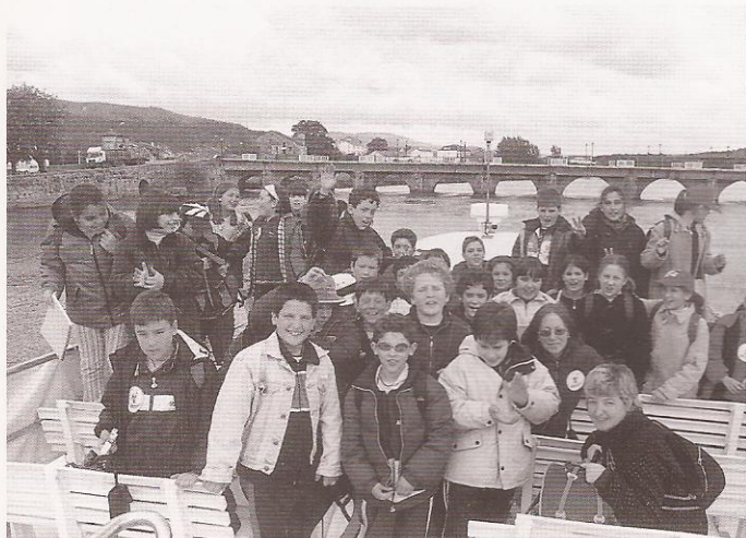
Alumnos de 4º do colexio "Rosalía de Castro" no barco "Ruta Xacobeas".

Era un 15 de maio; o día non estaba o suficientemente bo para facer a viaxe, pero a nosa ilusión estaba por riba de toda meteoroloxía.