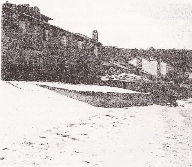
A la izquierda y señalizada está ya terminado, el inmueble en cuya cimentación se identificó el horno y escombrera de ánforas GALAICO-ROMANAS, del que damos noticia aquí. En primer término, típico patin de tradición marinera con su correspondiente escalerilla. El da acceso a ruinoso nave salazonera de principios de siglo (?), que se conoce con el significativo y precedente nombre de A Capela.