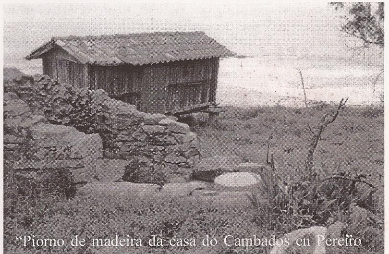
“Piorno de madeira da casa do Cambados en Pereiró