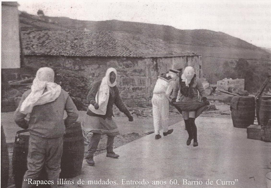
"Rapaces illáns de mudados. Entroido anos 60. Barrio de Curro"

Poucas veces naquel ano saíramos da Illa para vir a terra nos fins de semana. A beleza da primavera facíanos desexar a chegada do sábado e o domingo para percorre-lo