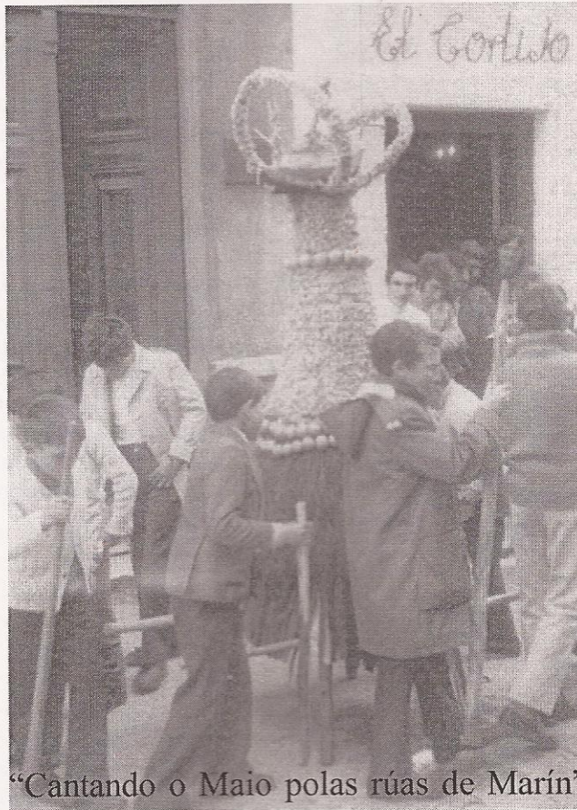
"Cantando o Maio polas rúas de Marín"