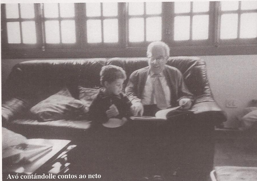
Avó contándolle contos ao neto

O conto popular galego é moi importante. É o protagonista do mundo rural e por isto foi polo que influíu en numerosos escritores coma Ánxel Fole ou Álvaro Cunqueiro, e tamén na Xeración Nós, cos relatos breves de Vicente Risco ou Don Ramón Otero Pedraio.