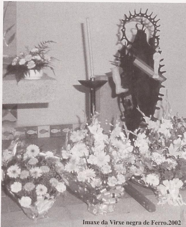
Imaxe da Virxe negra de Ferro.2002

_ ¡Levaron a Virxe negra!-, dixeron case todos á vez