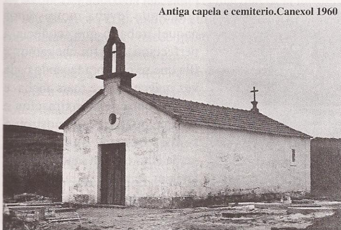
Antiga capela e cemiterio. Canexol 1960

Moitas veces me tiña fixado naquela imaxe negra da Virxe feita de ferro forxado e con inusuais formas recortadas no seu perfil. Era unha obra de arte modernista que alguén quixo facer compaxinar co edificio da nova igrexa parroquial que rachaba do mesmo xeito coa paisaxe e coa realidade mesma da Illa afeitos os seus veciños ao vello templo do Canexol no complexo do camposanto que servira ata poucos anos antes para xuntar aos vivos e aos