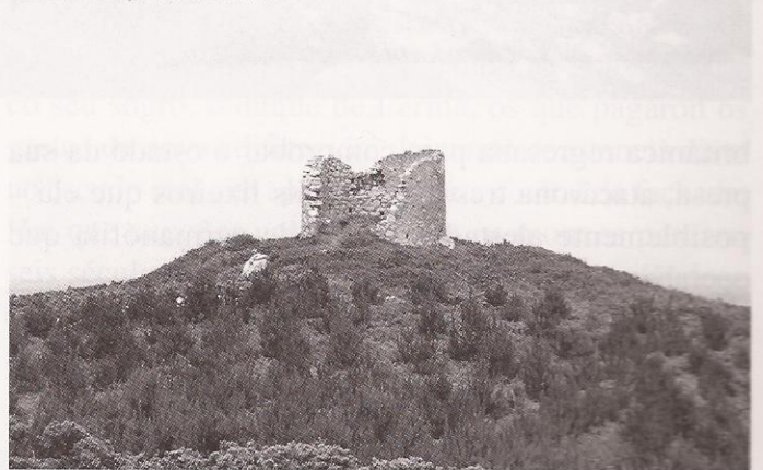
Muíño nº 3, o máis afastado

avión británico o descubriu, sen darlle tempo a realizar a inmersión que rapidamente ordenaría o seu comandante.