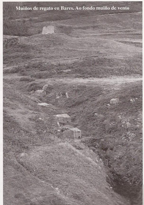
Muíños de regato en Bares. Ao fondo muíño de vento

Alguns dos puntos onde se localizan estes muíños están rente ó mar, como os que se atopan nas inmediacións da Estaca de Bares, enigmático lugar onde o mar e a terra fúndense para proporcionar ós veciños o sustento, aínda que nunca será doado arrancarllo.