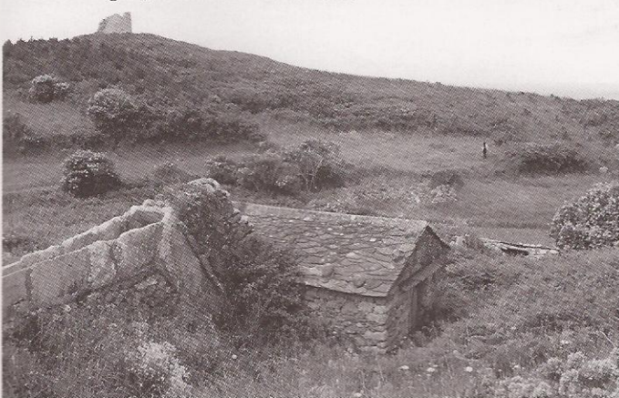
Muíño de regato, ao fondo muíño de vento

baixa – ollo os navegantes –, hai que subilo, e non é doado para todos. Coidado cos nenos.