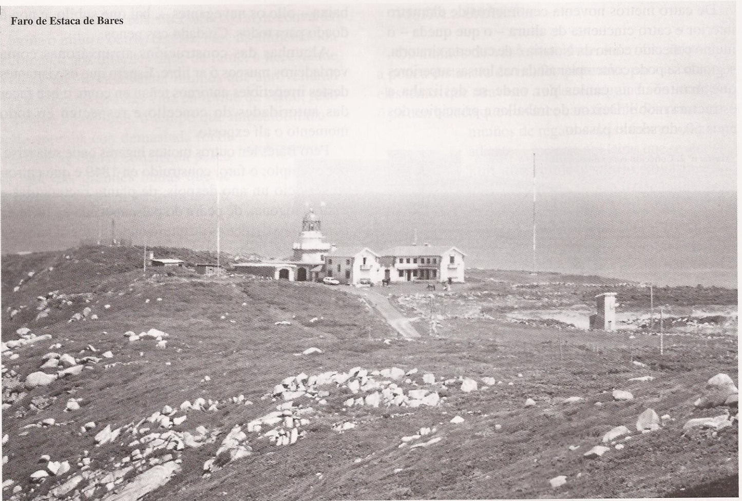
Faro de Estaca de Bares

británica regresaba para comprobar o estado da súa presa, atacárona tres avións máis lixeiros que ela – posiblemente alertados pola rede xermanófila que operaba na zona - que, con certos disparos, o derribaron, morrendo os seis ocupantes do aparato.