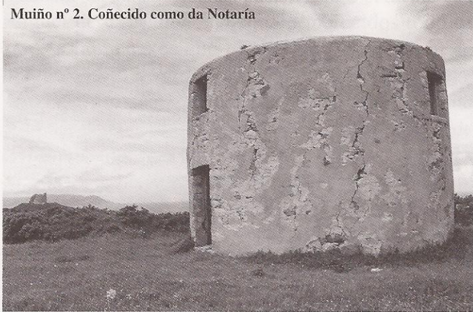
Muíño nº 2. Coñecido como da Notaría

O terceiro queda un pouco máis apartado da poboación, situado nun outeiro, pero de doado acceso; o solitario muíño traballou ata a década dos anos 50.