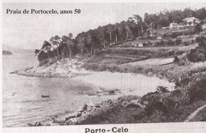
Praia de Portocelo, anos 50

A soldadesca napoleónica, desconfiada e medoñenta, polo si ou polo non, non ousaba meterse na furna; así que covarde pero práctica e expeditiva, unha soleada mañanciña de primavera decidiu voala. Tras o estrondo, un alude de pedras, xabre e tullo envorcou no areal atuíndo a camuflada e angosta entrada. ¿Que que foi de MARÍA DA MANTA? Fácil digo eu adiviñar o sucedido; doado, diredes vós, barruntar o resultado.