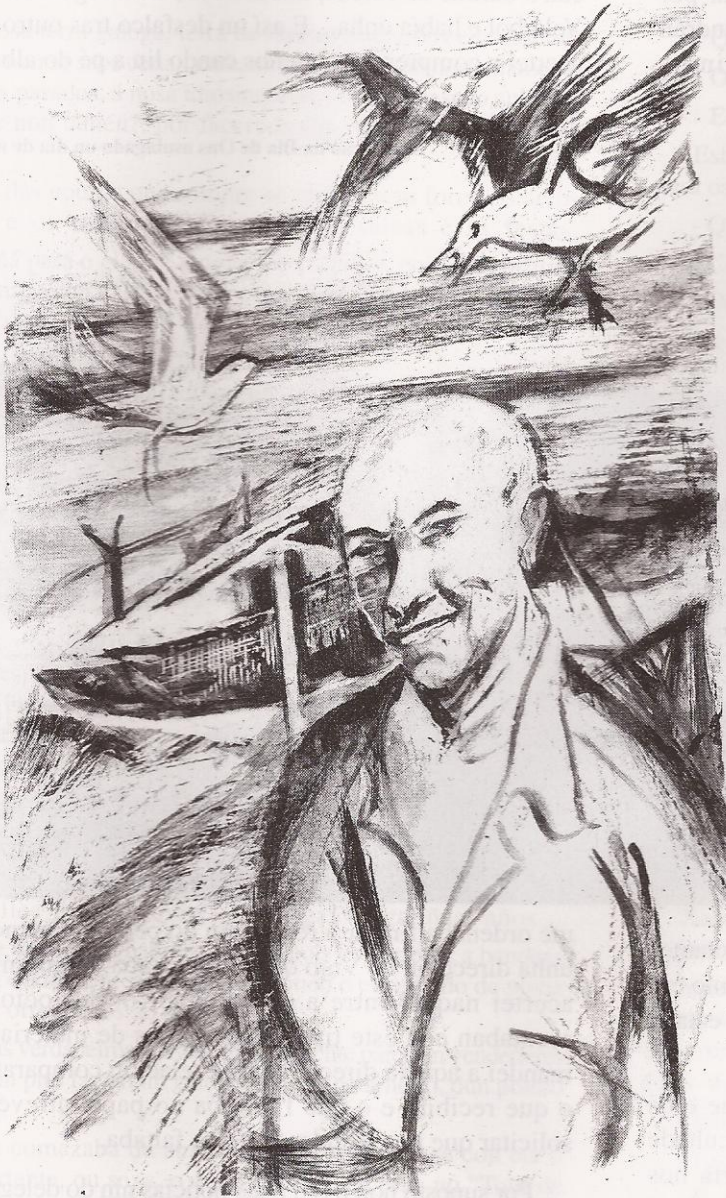
Ilustración de Xosé Conde Corbal