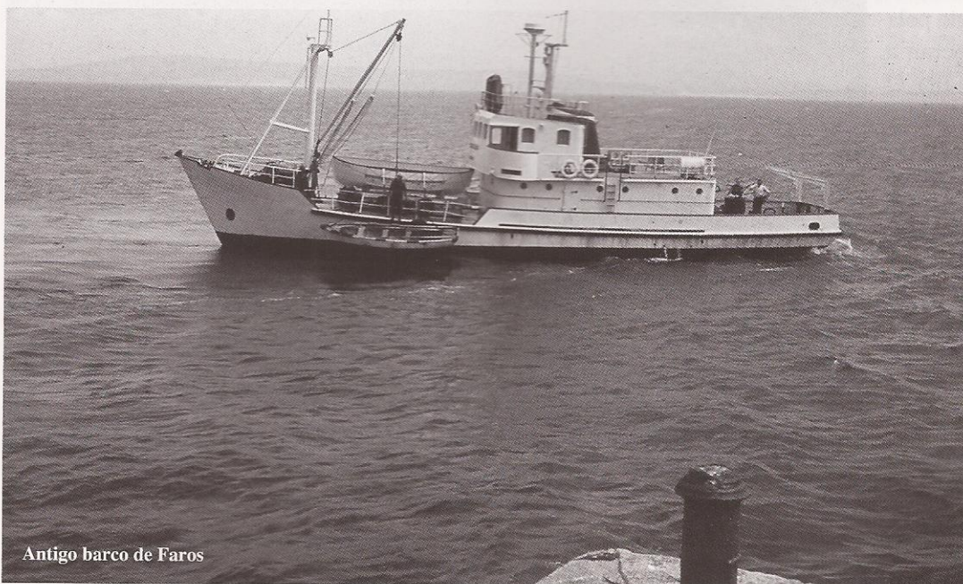
Antigo barco de Faros

O alcalde pedáneo chamou á porta da escola. Viña cunha nova que nos sorprendeu pola inmediatez do anuncio xa que nos avisaban que, ao día seguinte, chegaría de mañanciña un barco con autoridades e persoeiros que viñan visitar a Illa