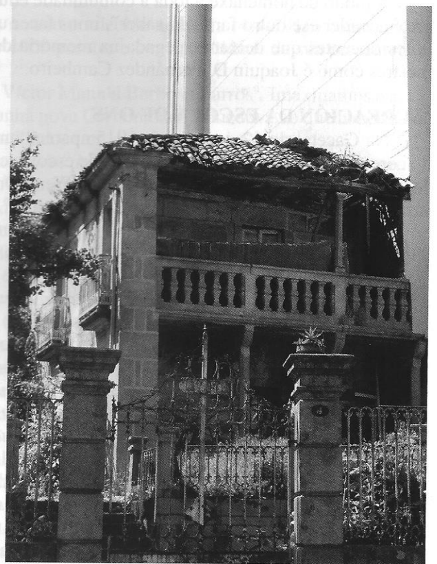
As ruínas do único Pazo existente na vila do que soamente queda a metade en pé.