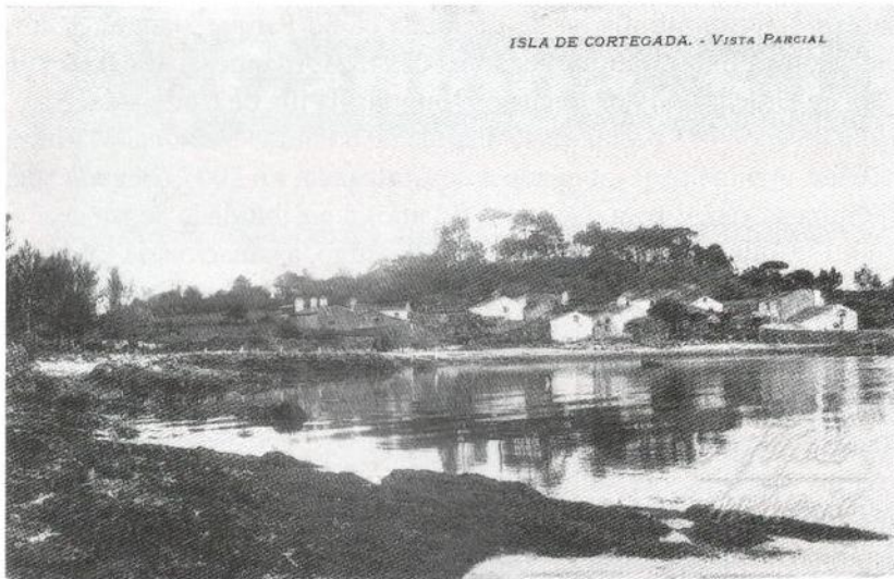
A illa de Cortegada a finais do S. XIX

Nese momento a illa distaba moito de ser un lugar deshabitado e sen uso que se puidese ceder sen máis ao monarca. Vivían nela 17 familias, cun total de 71 habitantes, pero o número de propietarios de terreos na illa era considerablemente maior, de 211, xa que a maior parte da súa superficie estaba cultivada e había máis de 1200 leiras que eran explotadas polos veciños de Cortegada e por outros moitos veciños da zona. As fotografías antigas da illa mostran unha imaxe completamente distinta da que Cortegada nos ofrece hoxe en día, xa que os numerosos campos de cultivo facían da illa un terreo con poucas árbores, coa aldea perfectamente visible dende terra.