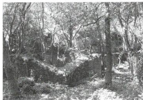
As casas da aldea están agora agochadas tras as árbores

Ó quedar abandonada e libre de explotación, as árbores foron devagar recolonizando os terreos antigamente