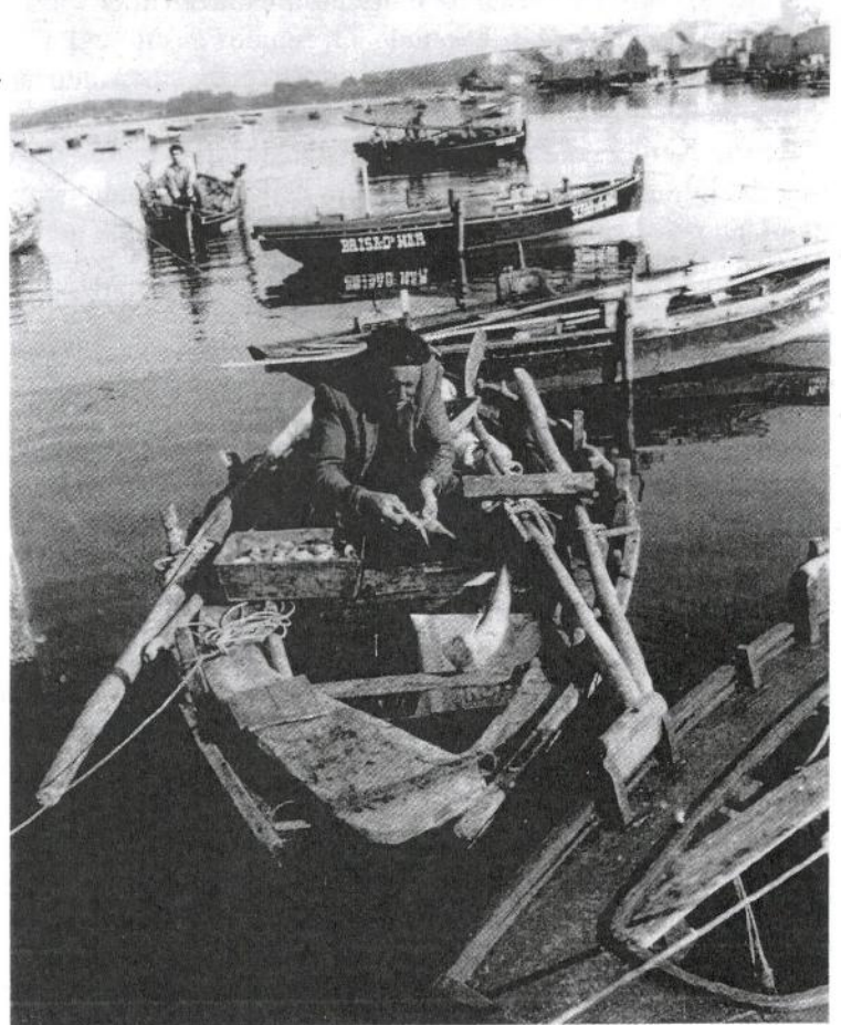
Dornas no peirao de O Grove. Medios anos 50 s.XX

Volvendo ao s. XVIII, vemos que, en 1775, se instaurou un Montepío proposto polo ilustrado e anticatalanista D. Josef Cornide Saavedra, para mitigar a fame que estaba a pasar o mundo do mar galego. No número 17 (2012) desta revista Aunios escribín un artigo sobre a fame no mar do Grove e a adhesión do gremio de mar da vila a este montepío en 1777.