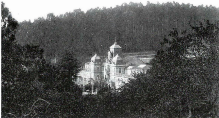
47. PONTEVEDRA.-PALACIO DE LOURIZÁN

5º.- Soa estraño que o comisionado se dirixira ao Cabido directamente, cando el, sendo cura de Sanxenxo, podía ter coñecemento de que unha familia, descendentes dos Montenegro, durante os últimos séculos, tiña aforada a Illa e que houbera numerosos preitos con persoas, un bo número da zona de Noalla, que intentaron usar os terreos illáns sen permiso e que estes se resolveron no xulgado de Cambados.