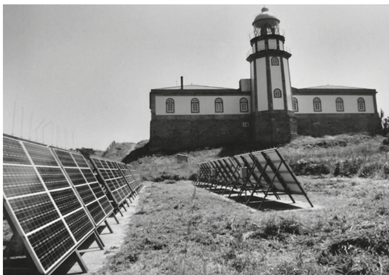
Instalación de paneis solares. Foto realizada en 1998