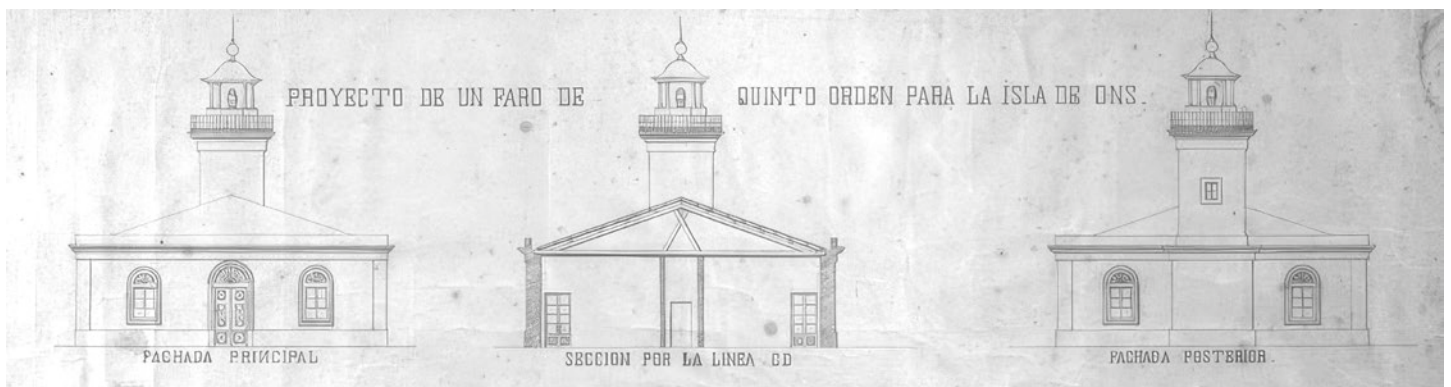
Proxecto do Faro de Ons.

Non direi que as visitas ao faro eran continuadas, pero si que se fixeron varias, eu polo menos, sempre en compañía de membros da asociación citada, o que si mantiñamos era unha fluída charla co fareiro cando baixaba ao “pobo”, ou sexa, á de Checho ou Acuña, que por aquela, e agora, eran os que fornecían os comestibles e bebidas, sobre todo cando o mar dificultaba a chegada do barco coas subministracións.