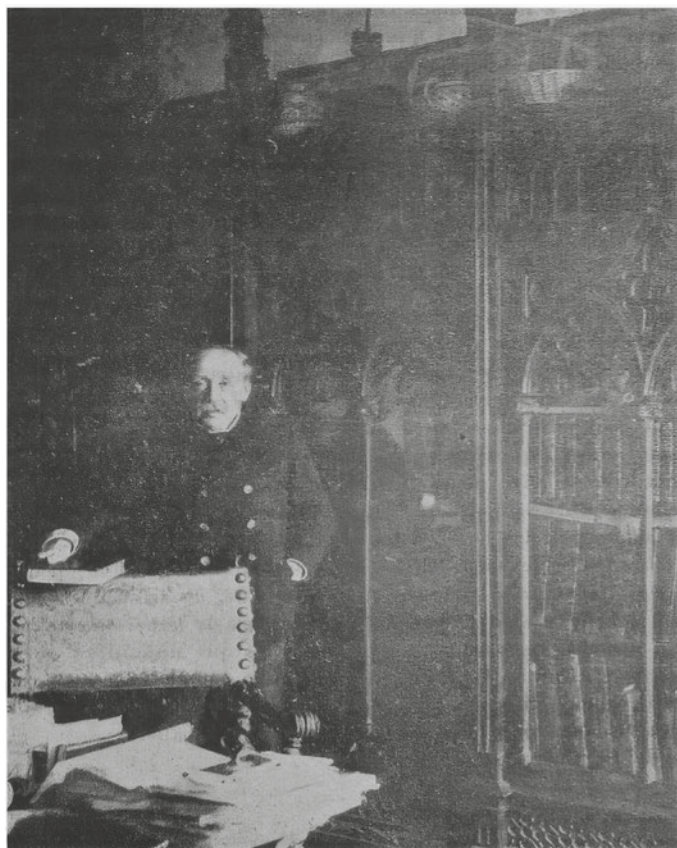
No seu despacho, 1898. Fotografía reproducida na revista Galicia Moderna