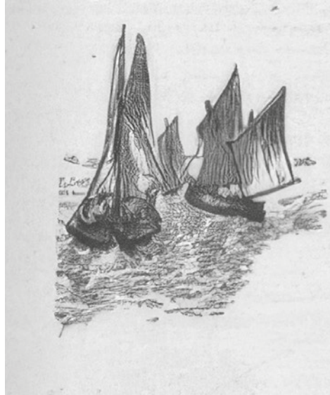
Ilustración de Juan G. Lara presente no libro Pontevedra. Recuerdos, monumentos, música y costumbres (1900), de J. López Otero

Cando me poño á mirar para ti, mar da Lanzada, vexo que levas gardada da miña vida pasada unha historia de pesar. Vícheme ti, ben rapaz, por estas prayas brincando, e n-eses días de paz, ser da miña mai solaz seu agarimo buscando. Máis tarde, xa mozo novo, xunto á meu pai traballei; mais a dura lei do pobo arringoume com'un lobo para o servico do rey. Volvín dempois, pobre e cheo de coitas e desenganos; meu pai xa se fora ô Ceo e eu collín o seu emprego, e pasaron moitos anos. Soilo ti, mar da Lanzada, tés dende aquela pra min no fondo amargo gardada a chave da ucha pechada do duro pan que comín. Envolto en brétemas frías vinte berrar con furor; vin a maldá que encobrías, que sempre andas ás porfías c'o bote do pescador. Vin a ola que s'escarrancha contr'o barco, feita escuma, cando tragar quer'a lancha e nin da bóveda ancha siquera un luceiro aluma. Foi meu bote á embarrancar desfixose n-un penedo, caeron meus fillos ô mar eu detrás... e inda de medo parés que os oyo chorar. ..... ¡Noite fera! Eu os chamaba berrando á todo berrar, e a miña voz s'anegaba no vento que me arredaba d'os qu'eu quería salvar.