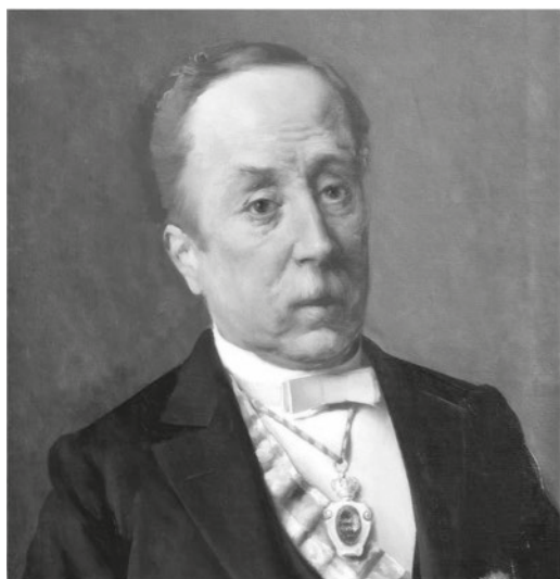
Retrato ao óleo de Luís Rodríguez Seoane. Consello da Cultura Galega

Mergullarse na produción literaria galega do século XIX, sobre todo naquela fracción habitualmente menos (re) coñecida, resulta un exercicio grato, interesante e cheo de sorpresas. Esta reflexión é especialmente válida cando o que nos agarda na lectura deses textos normalmente esquecidos conecta con intereses inmediatos que nun instante dado nos poidan ocupar. Así acontece co texto que hoxe suscita este noso artigo e que confeccionamos con moito pracer para unha revista, Aunios , que está afrontando as súas derradeiras travesías despois de ter rendido un servizo divulgativo e cultural verdadeiramente impagábel, que moito agradecemos na parte que nos toca. Beizóns!