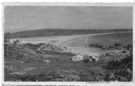
Praia da Lanzada. 1952

A luz do día primeira topoume no chan tendido da desleirada areeira, e baixo o mar escondido todo o sol da vida enteira. Mortos meus fillos, sin modo de vivir, xa n-este mundo para min abonda todo, xa son penedo que rodo sin parar hastr'o profundo. Xa, xunt'ô meu lar non miro á ninguén por quen chamar, ti serál-o meu retiro, mar por quen triste sospiro, mar da Lanzada... ¡meu mar! Com'as bágoas que chorei salgadas son tuas olas, se maldiciós che botei ningunha noite deixei xunto de ti vir á solas; Ningunha noite que bramas deixei eu de acompañarte e cand'as olas entramas ben t'oyo como me chamas pra que de ti non m'aparte. E cando fungand'os ventos t'azoutan, mar da Lanzada, penso que antr'os seus acentos inda oyo aqueles lamentos d'aquela noite lembrada. Se cal fuches cobizoso das miñas prendas un día quixeras darme bondoso no teu fondo rocolloso unha sepultura fría, xunt'estas olas ferventes que arrolan o santuario, quizais topara os qu'ausentes dend'as cobas transparentes chaman por un solitario. Chámanme porque na vida todo m'arringou o mar e se a deuda está comprida, dame ¡ouh mar! fosa esquencida e leito en que asosegar.