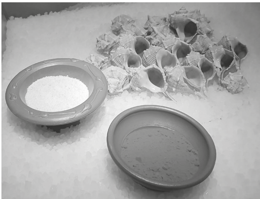
Conxunto de Murex, sal e púrpura. Foto sacada no Museo Arqueolóxico de Vigo. Salinae.

Facía falla moito sal. Había moito peixe. Necesitábase o tan ansiado Garum 1 para os pratos dos cidadáns podentes do Imperio Romano, tanto en Hispania como no resto do mesmo.