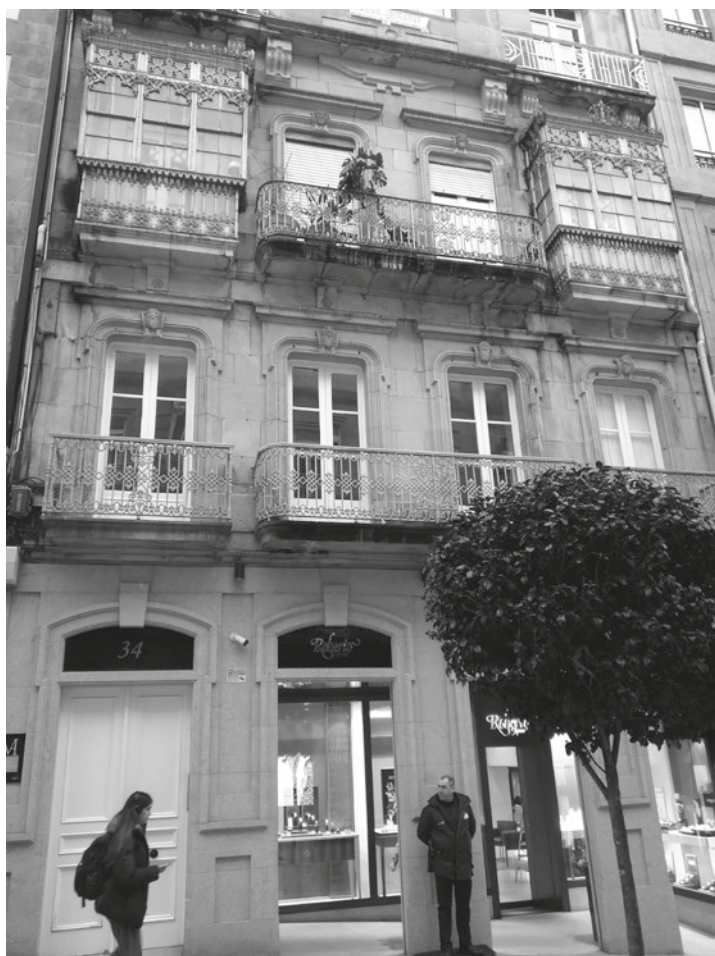
Casa da rúa Velázquez Moreno. Vigo

A exitosa execución deste inmoible en Vigo guinda un dato relevante e fundamental para comprender a orixe da