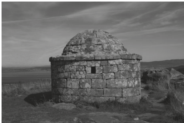
Facho de Cabo Home. Cangas

Nas illas Cíes, poderán percorrer as rutas que Parques ten deseñadas.