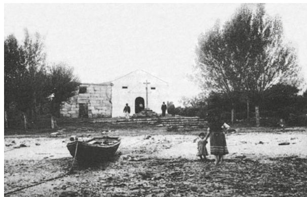
Foto antiga da capela da Illa de Cortegada. Vilagarcía

Selado: Obrigatorio en Cambados, Vilanova, Vilagarcía e illa de Cortegada.