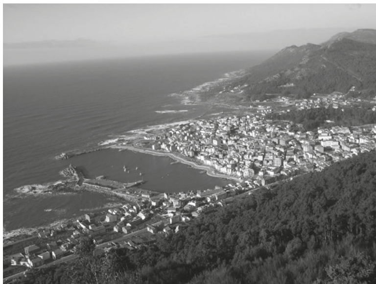
Vista de A Garda dende o Castro de Santa Tegra

Unha iniciativa fantástica que fai pensar que para o 2027 esa Ruta Xacobeá Marítima poda comezar a súa verdadeira singradura institucional por parte da Xunta.