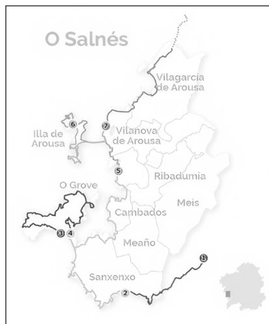
Itinerario da ruta do Pai Sarmiento. https://www.osalnes.com/es/

No concello de Oia, coñecerán o seu mosteiro, visitar os numerosos e interesantes petróglifos da zona e, segundo a época e día do ano elixido, poderán gozar dos Curros (Rapa das Bestas) que se celebran na Serra da Groba como os da Valga, Mougas, Torroña e ata os famosos Curros das Moscas.