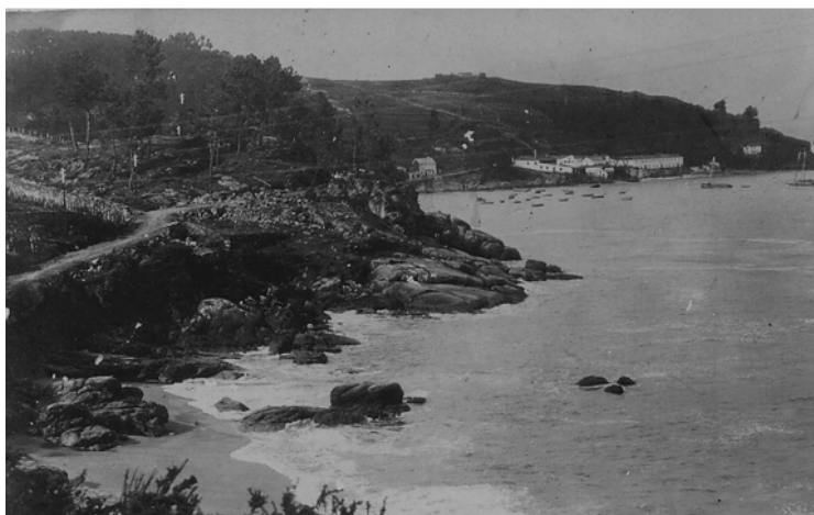
Camiño da praia de Beluso

É don Homobono O home de máis sorte que hoxe en día se coñece por estes lares. Cada un dos seus pasos, márcalle un camiño de satisfacción e benandanza. Todo lle sorrí e leva da vida felicidade completa.