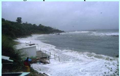
O chiringo durante unha forte marusía.