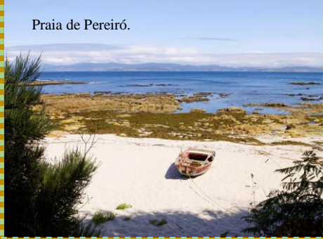
Praia de Pereiró.