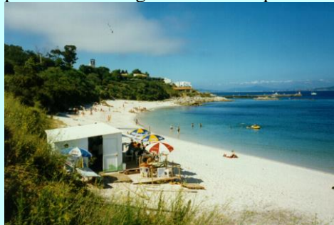
O chiringo nun precioso día de praia.

Só o mar foi quen de facer cambiar de lugar ese espazo engaiolante que, aínda que o cambio foi a mellor en espazo, sempre quedará nas nosas retinas a maxia enmeigante que tiña a noite no primitivo chiringo ao carón da praia.