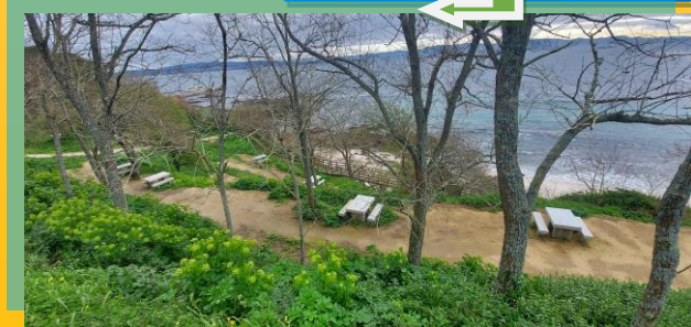
Foto: Mesas colocadas no ano 2019 na baixada a Area dos Cans.

Dende Pineiróns tamén se solicitou a Parques o cambio das deterioradas e antihixiénicas mesas de madeira que había na baixada á Praia de Area dos Cans. Coidabamos que unhas de pedra, como as que había na antiga zona de acampada de Chan, serían as ideais. No verán de 2019 arranxaron esa zona e colocaron unhas mesas adecuadas que, neste verán 2020, quedaron inutilizadas por mor do Covid-19.