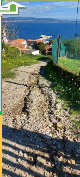
Foto: Camiño arranxado e moi deteriorado despois do inverno.

No verán do pasado ano 2019 vimos como dende a administración se levaba a cabo o arranxo de practicamente todos os camiños da Illa, cousa que agradecemos ao ser unha reivindicación que Pineiróns leva pedindo dende hai máis de 13 anos. Aínda así, a asociación recomendaba que antes da execución destes traballos, se realizara un estudo sobre os terreos, pois sabemos que o inverno é duro neste arquipélago e uns pequenos desniveis do terreo, provocan correntes de auga que traen como resultado o seu deterioro e como consecuencia volver a arranxalo de novo co conseguinte gasto económico que podería empregarse noutra necesidade.