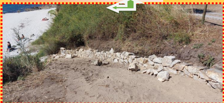
Foto: Baixada á praia de Canexol. Inicio das obras.

Con alegría vimos que este ano están traballando no arranxo da baixada elixida, con máis ancho e utilización de pedra. Esperemos que quede ben.