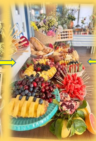
Interior do restaurante Casa Acuña, preparado para recibir aos invitados á celebración.