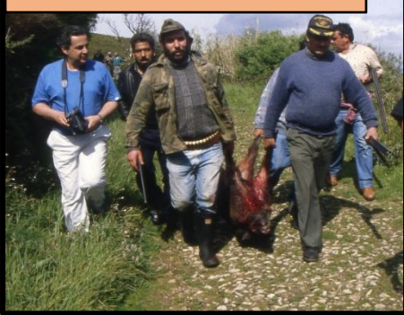
Levando o xabaryl abatido a Curro

Comezou a batida sobre as 10 da mañá pola zona indicada, pero non tivo éxito. Os cans collían o rastro, pero pronto o perdían con tanta pegada de coello, o que provocou un desmoralizador comezo e optaron por ir xantar e esperar á tarde.