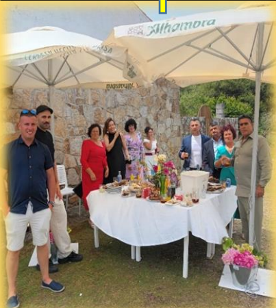
Sesión vermú no exterior do restaurante.