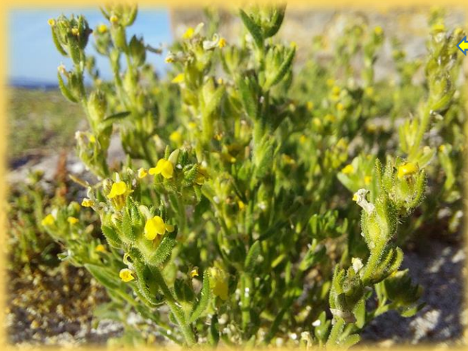
Foto da Linaria arenaria sacada na duna de Canexol e enviada pola autora da suxestión.

Quero agradecer a esta lectora por poñerme ao día con respecto a esta planta en Canexol e Melide, cousa que me alegra moitísimo, aínda que, sigo pensando, que se non se protexe esa duna, a Linaria e a duna sufrirán moito. Non estaría de máis unha pequena charla aos veciños de Canexol e Pereiró sobre a importancia da duna e da súa vexetación. Patrimonio Natural esquecese dos veciños á hora de Educación Ambiental.