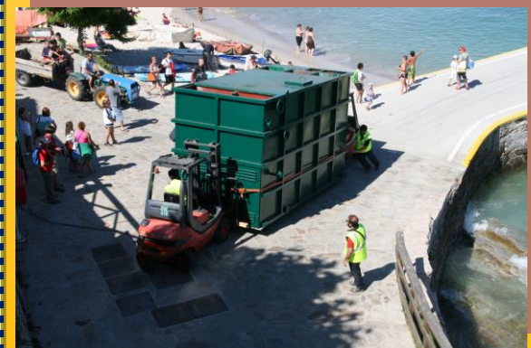
Foto arriba: Zona onde apareceron as posibles verteduras. Agosto 2020.