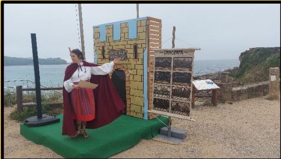
A actriz Alba de Vales escenificando a Revolta Irmandiña.