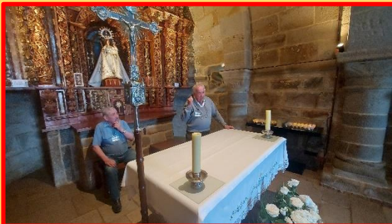
Veciños de Noalla contando anécdotas, cerimonia e rituais na Capela da Lanzada.