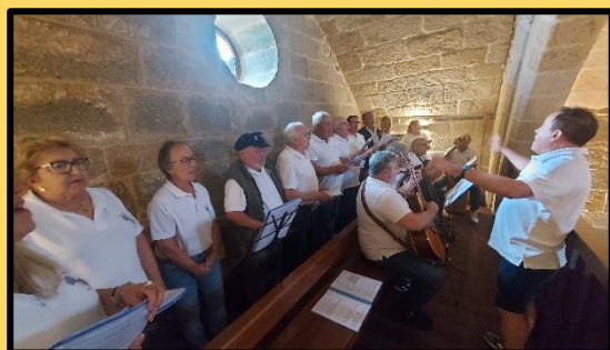
O magnífico grupo "Portonovo Canta" actuando na capela da Lanzada.

Seguindo co tema da páxina anterior, Foro de Turismo , o responsable de organización, como bo profesional, dinámico e excelente dinamizador, planificou unha Actividade que tiña que ver co turismo, coa historia e etnografía, coa relación coa veciñanza e coa música e, como non, tamén co a Illa de Ons pola súa proximidade. Buscou un medio de transporte, un antropólogo, unha actriz, varios veciños e un grupo musical.