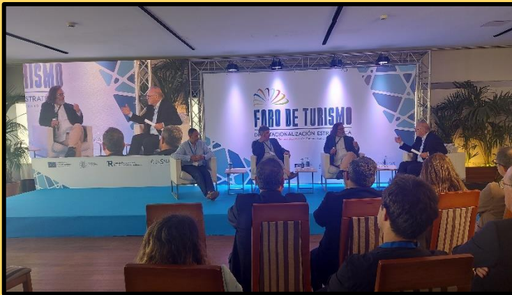
Foto esquerda: Un momento da intervención dos poñentes da Mesa Náutica.

https://viladebueu.eu/Revistas/Aunios/09/020_09_AsociacionPineirons.pdf