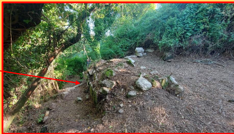
A esquerda a zona do muíño cando se limpou no 2012. Á dereita como se atopa agora, maio de 2026. Necesita unha maior limpeza.

Despois de solicitalo a través de Onstopus , os traballadores de mantemento con axuda dos vixiantes do Parque para a súa localización, levaron a cabo unha limpeza do espazo onde se atopa o Muíño , pero quedou toda a valgada sen limpar, co que, as persoas que deciden percorrer esa Ruta , ao chegar ao lugar, non poden visualizar nin o Muíño nin o pequeno bosque de árbores autóctonas galegas que no seu día foron plantados.