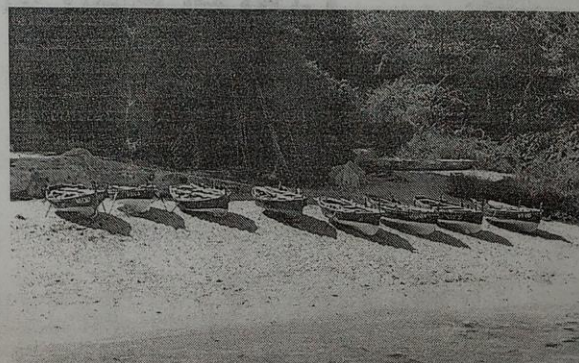
Varias dornas en la playa conocida como Praia das Dornas.