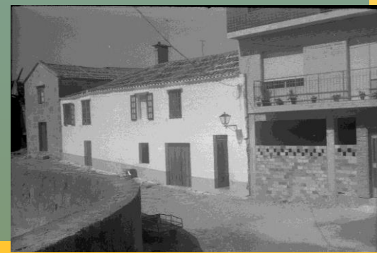
Arriba: Casas de Massó.