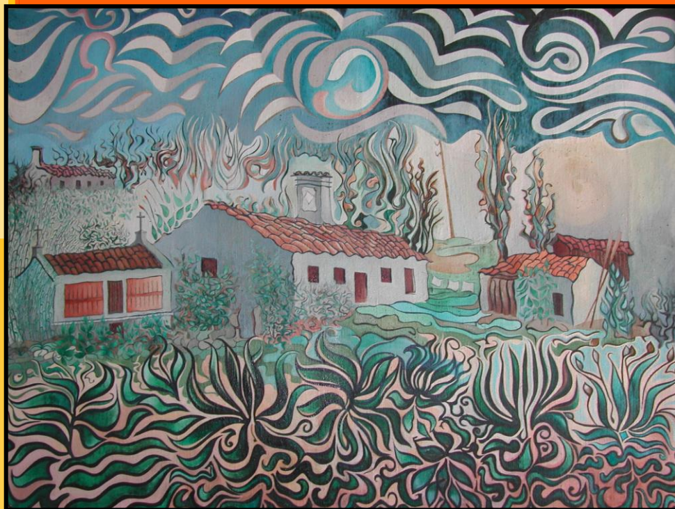
Vese arriba, á esquerda, a última casa do barrio, ocupada no ano 1980 pola administración para almacenamento de víveres para os campamentos.

https://www.caimanediciones.es/ons-alfonso-zarauza