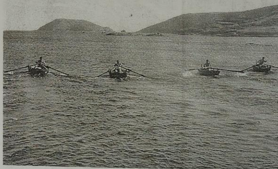
Imagen de la última regata de dornas celebrada en la isla de Ons, durante las fiestas de San Xaquín.