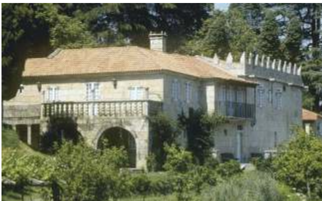
Pazo de Santa Cruz