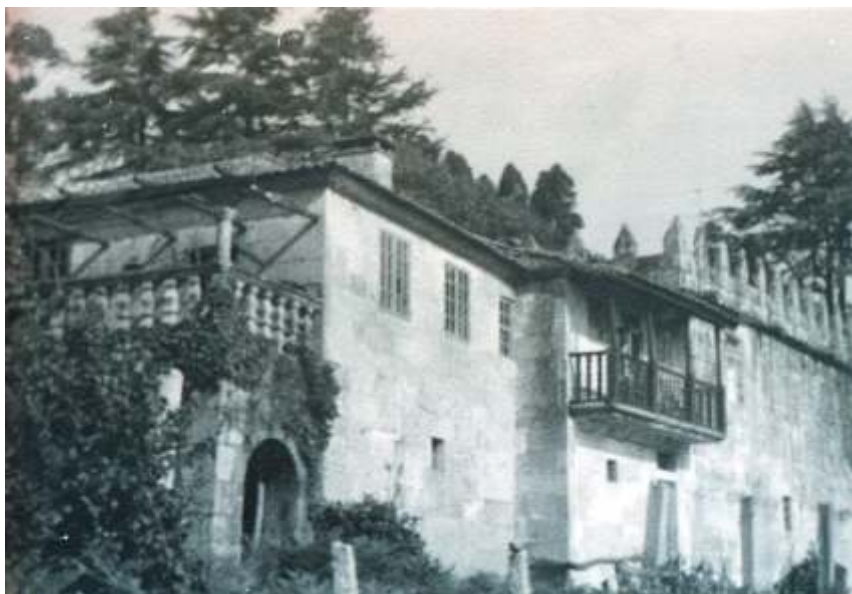
Pazo de Santa Cruz