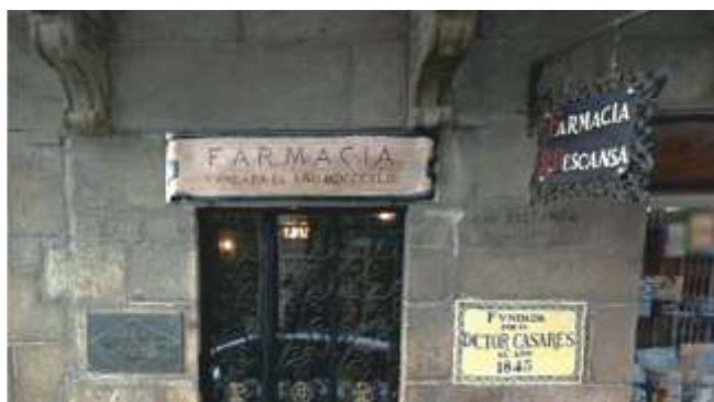
A Farmacia Bescansa en Santiago

No 1909, cando tiña que presentarse no alistamento para o servizo militar, aparece nas listas de Bueu pois aquí nacera. Pero na Acta da sesión de alistamento fíxose constar, por parte do Síndico, que levaba máis de dez anos sen residir entre nós, xa que o facía na casa dos seus país en Santiago de Compostela polo que non houbo problema para excluído e que este fora formando parte dos mozos a quintas do concello compostelán.