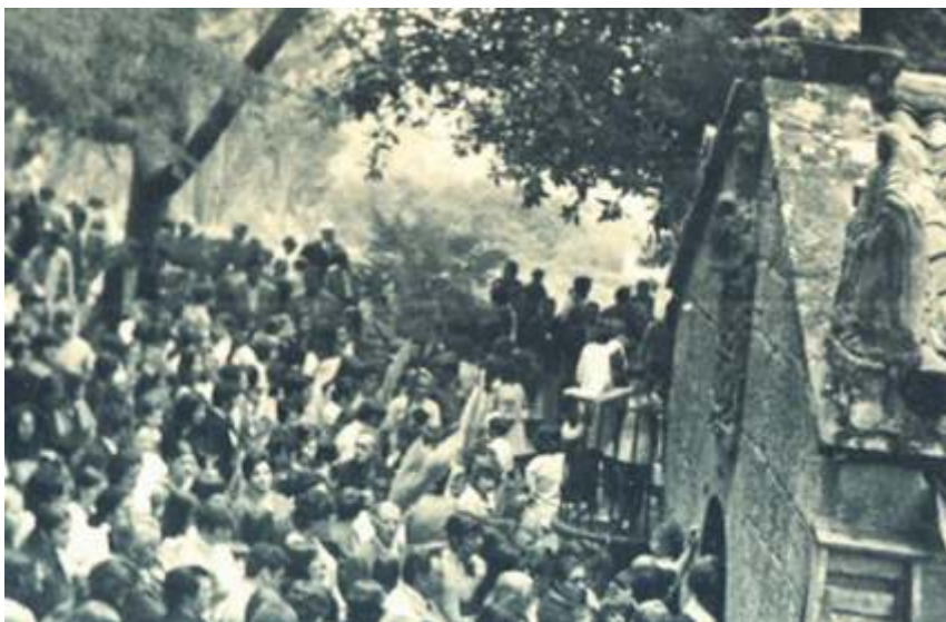
Celebración de Santa Efixenia