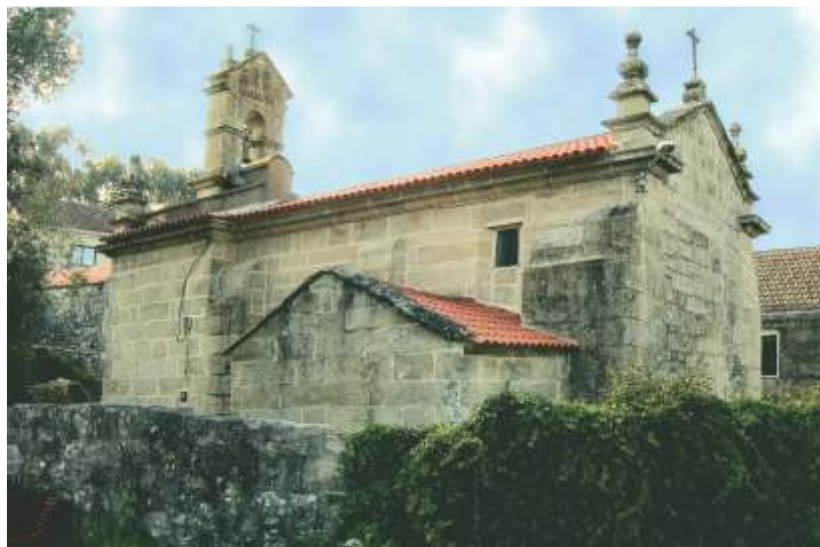
Igrexa e mosteiro de Ermelo

Na contorna do Morrazo poderíamos poñer de exemplo de motín contra os cobros dos foros para o Mosteiro de Poio, o intento que houbo en Moaña en 1809, afogado polos mesmos veciños. Ou o que se deu en Ermelo-Bueu o 11 de xuño de 1810 cando na tarde dese día uns douscentos homes armados con escopetas, fouciñas e paus, entraron no Priorado de