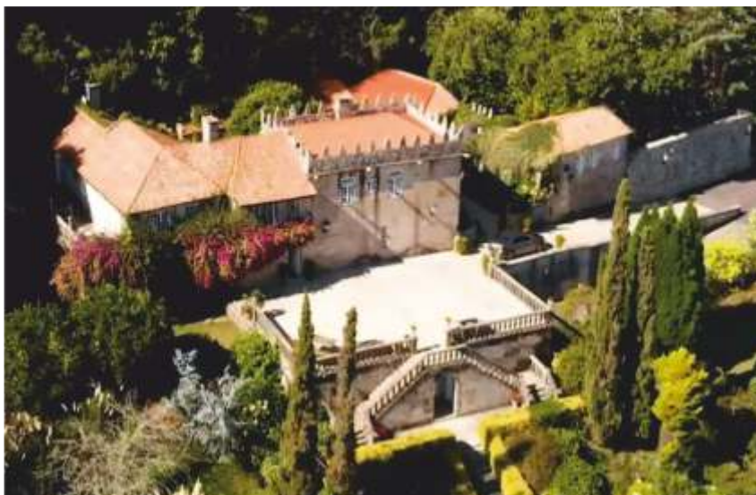
Pazo de Santa Cruz. A Ramorta - Bueu

“Dn Pedro Pimentel de Soutomayor Rúa y Aldao, oficial retirado de los Ejércitos Nacionales, Patrono de los patronatos de los Santos Reyes, y de otros curatos, capellanías y simples, Señor del Placer y normal paridor del vínculo que se rienda de esta Casa y Torre de Santa Cruz” 3 .