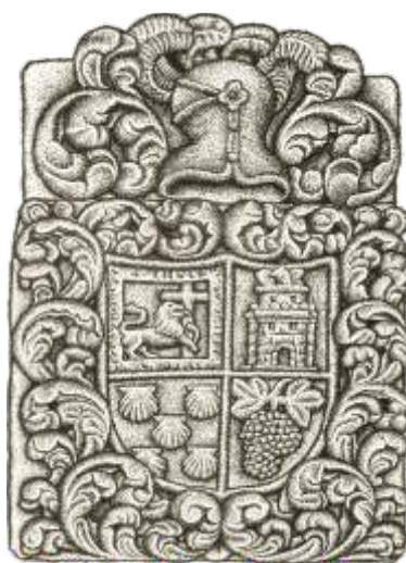
Brasón en Santa Cruz Debuxo Rafael R. Fdez-Broullón

E para deixar constancia de que non é só un problema individual segue a dicir: “Lo mismo sucede a todos los Propietarios forasteros de aquel País, como son Santa Clara de Pontevedra, Priorato de Ermelo, Condes de San Román, y Maceda, Duque de Sotomayor, y otras varias corporaciones y particulares que hasta ahora han conservado la posesión de sus legítimos derechos: como la contribución extraordinaria de guerra se halle impuesta precisamente sobre rentas y utilidades liquidar, y no sobre derechos y acciones, y estos propietarios se vean privados de aquellas para las antecedentes causas, parece debe tener lugar el artículo 17 del Decreto de S. M. de tres de septiembre de mil ochocientos doce; mientras que el señor Xefe Politico en quien por el artículo 1º del Capitulo tercero de la Ynstruccion decretada por S. M. en veinte y tres de Junio de mil ochocientos trece, reside la superior autoridad para cuidar de la tranquilidad publica, del buen orden, de la seguridad de las personas y bienes de sus habitantes de la esecución de las leyes y órdenes del Gobierno, dá las disposiciones convenientes para reprimir y contener a sus principios,